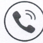
Soluções de Voz

A Mundivox possui rede própria e utiliza meios de transmissão ópticos. Isto proporciona total imunidade a interferências, menor latência e maiores velocidades, resultando em uma melhor qualidade final.