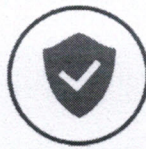
Soluções de Segurança