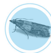
Pragas em produtos armazenados