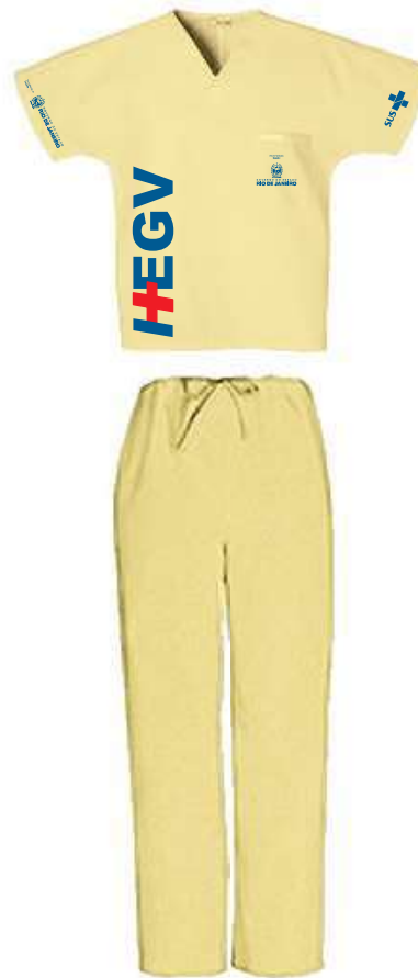
Roupa Tec. de Enfermagem Pantone 130915 TC