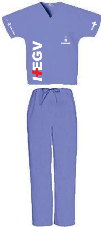
Roupa Médicos Pantone 173826 TC