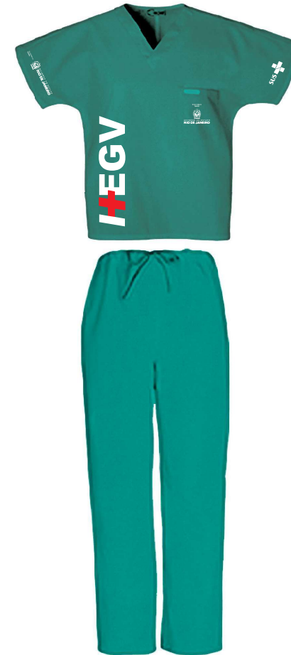
Roupa Enfermeiro Pantone 15-5516 TC